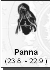
Panna (23.8. - 22.9.)

Éterickým, ohnivým a vášnivým Pannám detinskosť a ufnukanosť nesvedčí, tak neskľazajte tam, kam nepatríte. Tieto maniere nepoužívajte ani na manipuláciu s vašim okolím, nájdite si na to iný spôsob a to z toho dôvodu, že by to urobilo viac „paseky“ ako dobra, minimálne si to odpustíte na tento týždeň. Práve naopak, mali by ste predviesť vo svojom živote ľahkosť, radost a prirodzenosť, ktorá vám otvorí dvere aj tam, kde vám boli pred nosom zabuchnuté. Zabajujete (a aj si zabajujete v rámci situácií, do ktorých budete vhodnení) si trochu so svojím egom a sem-tam vykúkajúcim prejavom nadržanosti.