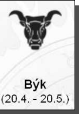
Býk (20.4. - 20.5.)

Tak, ako v predchádzajúci týždeň, aj tento bude prevažne o vzťahoch. Minule sa ukázali mraky, pre tieto dni bude platiť úplná idyla. Precitnete vo svojich, ale aj partnerových citoch do ich úplnej podstaty. Tešte sa z toho, že máte po svojom boku osobu, ktorá vás chápe a podporí za každých okolností. Na pracovisku sa všetko bude niesť na vlnách pokoja, mieru a príjemného, až rodinného tepla, ktoré by nemali narušiť vaše nesplnené povinnosti, preto si všetko splňte tak, ako ste si to naplánovali. Tento týždeň sa prejaví ako jeden z najužohodnejších na „odkomunikovanie“ všetkého, kde ste si pred tým ústa neotvorili.