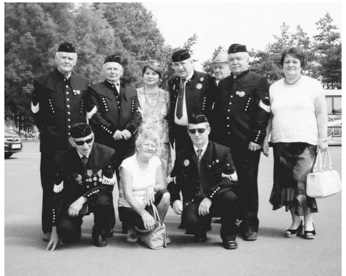
Členovia z baníckeho cechu sa na pamiatku zvečnili aj so svojimi manželkami