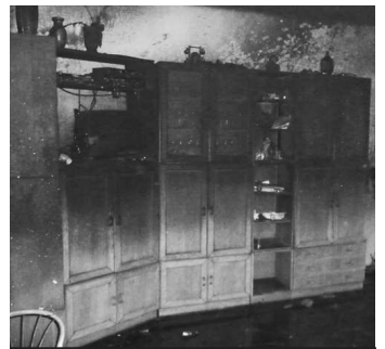
Obývačku rodinného domu v K. Kosihách pohltil plameň