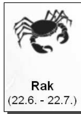
Rak (22.6. - 22.7.)

Tento týždeň bude symbolom šťastia a úspechu a práve po tieto dni bude patriť šťastie vášmu znameniu. Naložte s ním rozumne a využite ho tam, kde to bude potrebné – pomôže vám v práci (financie), v duchovnej sfére a pri vybavovaní všetkých úradných záležitostí, kde ste doteraz len pohoreli a nič nevybavili (povolenia, právne záležitosti, bankové inštitúcie a pod.). Nedobehne vás žiadny „šmejď“, ktorý bude chcieť z vás vytrieskať, či už peniaze alebo vás bude chcieť využiť na inom poli. V zdravotnej sfére bude najviac zaťažovaná oblasť hrudníka.