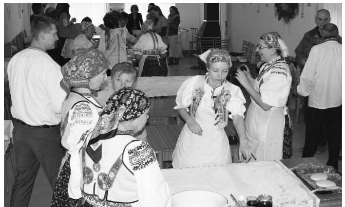
Miestnosť Zborového domu v Čelovciach sa zaplnila pestrofarebnými farbami krojov a vôní