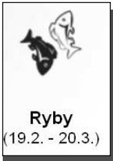
Ryby (19.2. - 20.3.)

Nepripúšťajte si všetko, čo bude adresované na vašu osobu, na vzťahovosť nie je čas. Musíte si dokončiť všetko, čo ste počas roka „rozbrblali“ a nechali tak, inak si vás to nájde, premôže sa a venuje tomu nejakú chvíľu. Sprška nespokojnosti, ktorú prejavuje okolitý svet, bude dopadať aj na vás, preto budete zápasit s nechuťou a vnútornými bojmi. Tu vám pomôže prítomnosť a sila milovaných osôb, ktoré vám prinesú svetlo aj tam, kde ho vy už nevidíte. Na lepšie časy sa blýska aj nezadaným rybám, kde sa otvára možnosť nadviazať skvelý a perspektívny vzťah – nenechajte si túto možnosť ujsť pod vplyvom chmúr sveta a aj tých vašich.