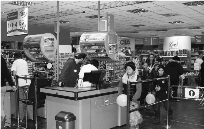
Ludia boli pred otvorením zvedaví, ako vyzerá KOCKA zvnútra a čo ponúka