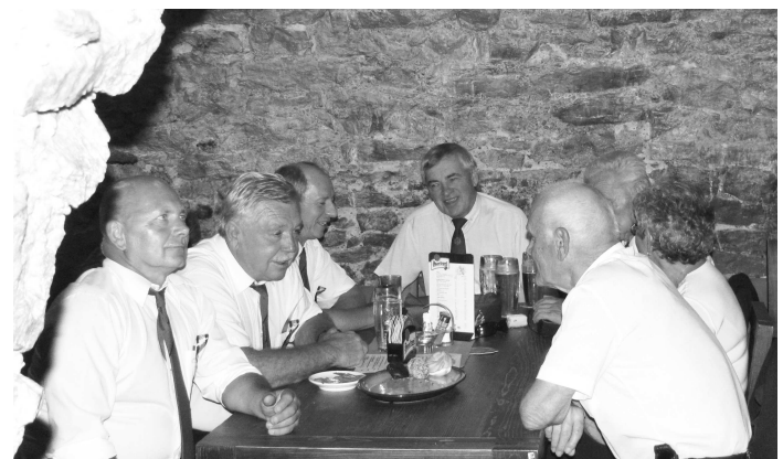
Po podujatí prišlo na rad občerstvenie v družnej debata o vydarenej cisárskej vizitácii