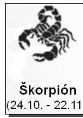
Škorpión (24.10. - 22.11.)

Potrebné a dôležité veci už neodkladajte na neskôr a radšej sa do toho pustite hneď. Síce sa stále presvedčate, že máte čas, ale ste si tým naozaj takí istí? Chýba vám rozprúdenie a „nakopnutie“, lenže to nik za vás nespriaví, preto to zostane, ako inak, iba na vás. Postavte sa všetkému (pracovné aj súkromné povinnosti, vzťahové záležitosti) tvárou v tvár a riešte to, jednoducho do toho skočte. Čím skôr povybavujete a budete vedieť, na čom ste, o to vám bude pocitovo ľahšie a zároveň vám zostane viac času na vychutnanie si príjemnejších stránok života.