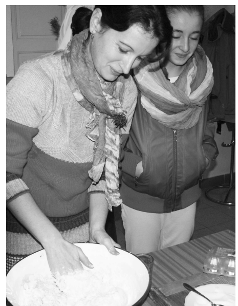
Cesto treba dobre vymiesiť - vedeli to aj ženy z domáceho družstva