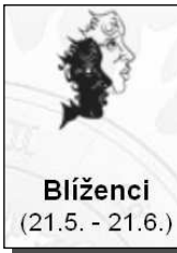
Blíženci (21.5. - 21.6.)

Budete sa cítiť ako pocietni, ktorí brázdia krajinu s neurčitým cieľom a prirodzene (necieleno) sprostredkúva svoje skúsenosti a vedomosti ľuďom, ktorých na cestách stretáva a ktorí o to stoja. Až do chvíle, kým vás na vašej „ceste“ (pomyselnej) vyhladá človek, ktorý si bude od