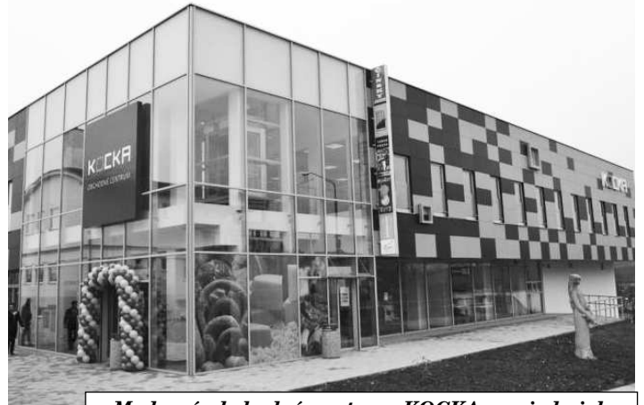
Moderné obchodné centrum KOCKA po siedmich mesiacoch nahradilo bývalý obchodný dom, po ktorom už ostali len archívne fotografie