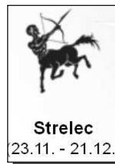
Strelec (23.11. - 21.12.)

Určite po tieto dni nič neriskujte a stavte na istoty. Dni prajú priateľským vzťahom, ktoré by ste mali oprášiť, vyrazte si s „kamšmi“ do ulíc a dobehnite všetko, čo ste zameškali. Je na to vhodný čas, nevyhováraajte sa na povinnosti a zariadte si to tak, aby ste im nejaký ten čas venovali. Univerzálne je potrebné vzťahy budovať, a teda ani tie priateľské nie sú výnimkou. Popri tom si dajte pozor v práci na donášanie a klebetenie a to v oboch smeroch, teda smerované od vás, ale aj od kolegov smerom k vám. Ak sa tak aj stane a dozviete sa niečo na svoju osobu, nevzpierajte sa, nerobte scény, pokiaľ ide o objektívnu kritiku, prijmite ju.