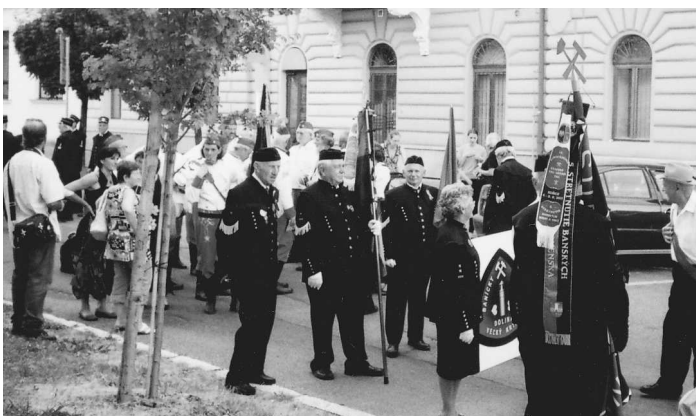
Banskobystrické námestie patrilo v tento deň baníkom