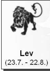
Lev (23.7. - 22.8.)

Stojíte nepohnute na jednom mieste, ktoré je podľa vás ideálne (vidíte všetkých, tak ako všetci vidia vás) a na niečo čakáte, problém je v tom, že ani sami neviete, na čo vlastne čakáte. Ale to len do dnešných dní, teraz presne pochopíte, na čo ste to vlastne čakali a pohnete sa vpred – priamou čiarou za tým. Nebojte sa, pôjde to bez väčších problémov – v skratke ste pochopili svoje sny a túžby a vyberiete sa priamo za nimi bez pocitu strachu. Začnete si vážiť všetko, čo ste pokladali za samozrejme a radost vám budú robiť aj úplné maličkosti. Vo vzťahoch sa prejaví dominantnosť žien, ktoré si konečne poriadne a chlapsky udrú do stola.