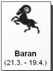
Baran (21.3. - 19.4.)

Vďaka sile vôle, ktorou po tieto dni budete disponovať, prekleniete záležitosti, v ktorých ste boli dlhodobo zamotaní a ktoré vás sužovali a ťažili. Aj tie najmenšie veci, ktoré by ste za iných okolností vnímali ako malichernosti, majú v poslednom čase na vás ťažký dopad. Pomaly, ale isto, však všetko opadáva a prechádzate do pokojnejších vôd vášho vedomia. Príliš ste sa sústredili na „nedostatky“ vám blízkych ľudí, až vás zavalili tie vlastné. S ústupom ťažoby prichádza pocit radosti a akého-takého utrasenia sa v prítomnosti. Už bolo naznačené, že pre váš rozkvet sú veľmi dôležité vzťahy a na tie by ste si mali posvietiť a začať si ich „pestovať“.