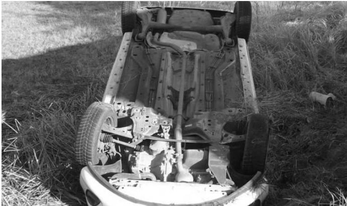
Pri nehode v Závade (foto hore) i v Čebovciach (foto dole) skončili autá na streche

V tomto ročnom období si už musíme uvedomiť, že prichádzajú prvé mrazy a s nimi sa zhoršuje aj kvalita povrchu našich ciest. Žiaľ, aj v tomto roku s prvými mrazmi prišli aj nehody, ktorých príčinou, pravdepodobne, boli práve námrazy na cestách a zhoršená viditeľnosť. Vodiči často napriek varovaniam neprispôsobujú svoje schopnosti a možnosti stavu vozoviek a poveternostným podmienkam.