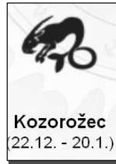
Kozorožec (22.12. - 20.1.)

Pripravte sa na silnú prívalovú vlnu klamstiev, ktorá sa bude rútiť z okolitého sveta s cieľom zmiastať vás a aj poriadne využiť. Prefikanosť bude priateľ iným, nie vám, preto je u vás obozretnosť a opatrnosť na správnom mieste. Nedajte sa obalamutiť sladkými medovými motúzmi, hlavne v oblasti financií (premyslite si, čo podpíšete a komu sa „upíšete“). Budete ľahkým terčom na využitie, preto, ak sa v takej situácii ocitnete, pokúste sa o nekompromisnosť a tvrdší postoj, aby to tá opačná strana správne pochopila. Na cestách si dávajte pozor na policajtov a preto majte stále na pamäti svetlá.