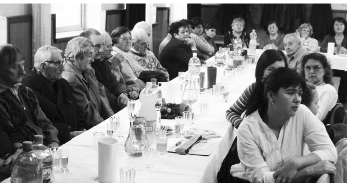
Pohľad na účastníkov stretnutia a najmladšia speváčka