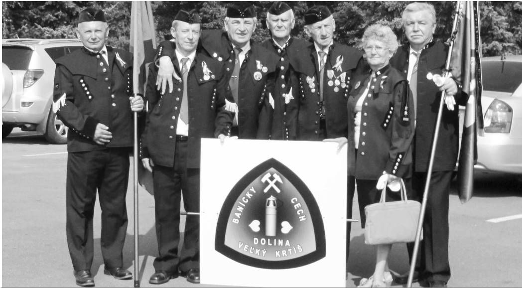
K slávnostnej atmosfére prispel sprievod baníckych cechov a spolkov baníckych miest Slovenska, medzi nimi aj ten náš z Veľkého Krtiša

Náš banický cech Bane Dolina vo Veľkom Krtiši prijal pozvanie, aby sa jeho zástupcovia ešte v júli zúčastnili na majestátnej cisárskej vizitácii 27. 7. t.r. cieľom vizitácie bola obnova baníckych tradícií, ale aj propagácia a poznávanie mesta a jeho okolia z pohľadu baníckej minulosti.