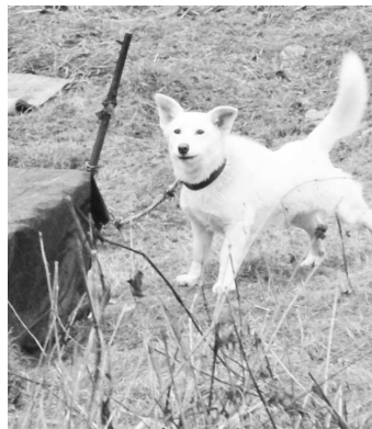
Inšpektorka nebola spokojná s dĺžkou reťaze, ktorou boli psy priviazané