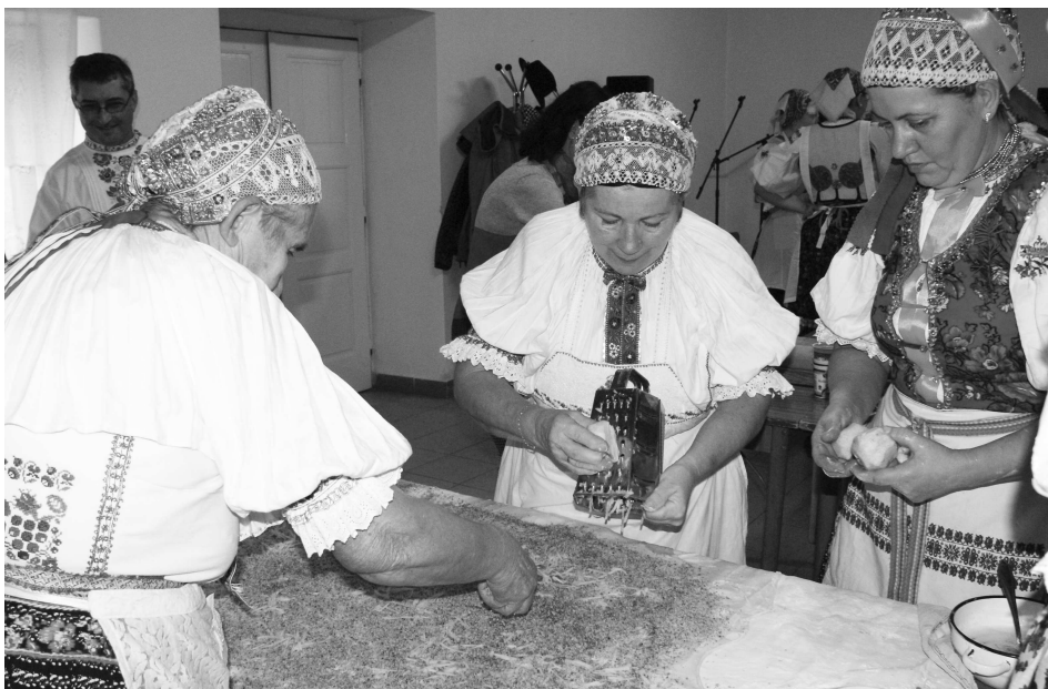
Ženičky z Hrušova sa činili a pripravovali aj štrúdlu plnenú orechmi a jablkami