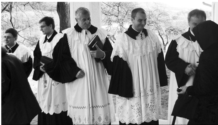
Duchovní pri východe z chrámu pozdravili veriacich podaním ruky