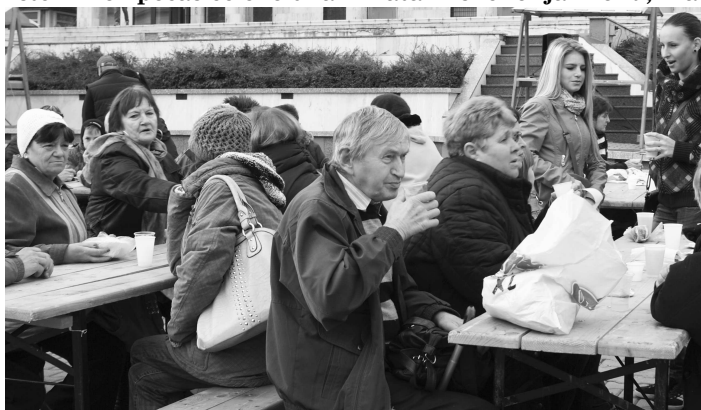
Veľkokrtíšanom voňavé zabíjačkové dobroty chutili