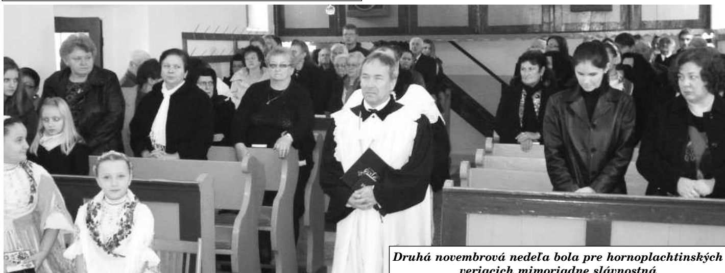
Druhá novembrová nedeľa bola pre hornoplachtinských veriacich mimoriadne slávnostná