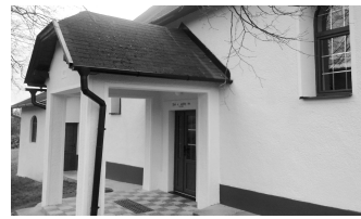
Zrekonštruovaný evanjelický kostol sa dočkal opravy zvnútra, zvonku, skrášlilo sa aj jeho okolie