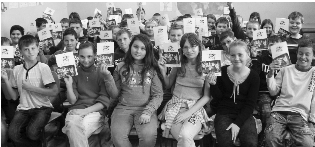
Prednášky boli určené žiakom 11 základných škôl na II. stupni a na štyroch stredných školách

Žiaci základných a stredných škôl aj v našom okrese, sa mohli dozvedieť viac informácií o škodlivosti drog. Na otázku, prečo ľudia v súčasnosti berú viacej pouličné drogy ako v minulosti, by bolo možno viac odpovedí. Iný názor by mal starší človek a iný mladší. Faktom ale ostáva, že ľudia berúci drogy trpia a trpia aj ich rodiny a blízke okolie, a v konečnom dôsledku má tento neuh jednotlivca vplyv aj na celú spoločnosť, ktorá je viac kriminalizovaná. Na opačnej strane sú ľudia, ktorí majú finančný prospech z ľudí užívajúcich drogy.