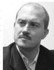
Ing. Mgr. Marian Kotleba, 36 r., je volebný líder politickej strany LS Naše Slovensko.

Absolvoval strednú školu Jozefa Murgaša v Banskej Bystrici, následne pokračoval v štúdiu na Prírodovedeckej fakulte Univerzity Mateja Bela v B. Bystrici, kde získal diplom v odbore učiteľstvo. V roku 2013 ukončil štúdium ekonómie na Ekonomickej fakulte UMB v B. Bystrici, kde získal titul inžinier ekonómie. Vyučoval na športovom gymnáziu v Banskej Bystrici, neskôr bol priradený za správcu informačnej siete.