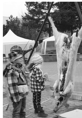
Mnoho Krtíšanov, nielen detí, si mohlo na vlastné oči pozrieť ako sa zo zabitého zvieratá stanú chutné klobásky