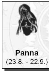
Panna (23.8. - 22.9.)

Karta srdca vám dáva na vedomie, že počas všetkých dní v týždni sa budete zaoberať vzťahmi. Citové prehlbenie, zalúbenie, vyznanie. Pre nezadané panny sa otvára ideálny čas na nájdenie toho „pravého“, na mieru šitého partnera. Dovoľte si na chvíľu vypnúť hlavu a všetko vnímať len cez svoje pocity a srdce (nemusíte sa báť, že ak vypnete hlavu, odrazi sa to v negatívnom smere v pracovnej oblasti), naučte sa ich počúvať a pracovať s nimi, uvidíte ako presne sa dá vďaka pocitom orientovať. Pomáhajte slabším.