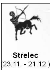
Strelec (23.11. - 21.12.)

Je čas všetko zanedbané dokončiť a dotiahnuť do zdarného konca. Sadnite si konečne nad papiere a povinnosti, pred ktorými ste doslovne „zdrhali“. Je naozaj nutná vaša osobná zainteresovanosť. Rokujte, riešte, analyzujte, dokončievajte, dopisujte a pod. – robte všetko, čo je potrebné a zároveň všetko, čo sa od vás, ako osoby, či už v súkromí alebo v práci, vyžaduje. Uši majte nastrožené a poriadne počúvajte každé, dokonca aj to najmenšie šuchnutie, pomôže vám to. Spojitosti a to v akom smere vám to má pomôcť, vypláva na povrch samé a trochu neskôr.