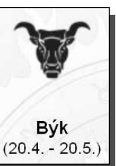
Býk (20.4. - 20.5.)

Nad býkmi sa veru blýska. Vytratila sa chuť fungovať a tešiť sa, do popredia prichádza smútok a vnútorná tma. Urobte s tým rázny koniec, inak sa v tých pocitoch utopíte. Vidina vašej ružovej budúcnosti (nech sa jedná o ekolovek – láska, peniažky, bývanie, podnikanie, materiálna vec) je bližšie, ako by ste sami dúfali, naberá na konkrétnych kontúrach a už dlhšie nie je iba rozmazaným obrazom v dialave. Chyťte sa tohto zistenia, rozhybte sa a začinite niečo robiť, či chcete alebo nie, musíte k tomu sami osobne prispieť. Tak, ako to býva u vás zvykom, pocítite precitlivosť v súlade na mesačné fázy tenkrát a niečo intenzívnejšie.