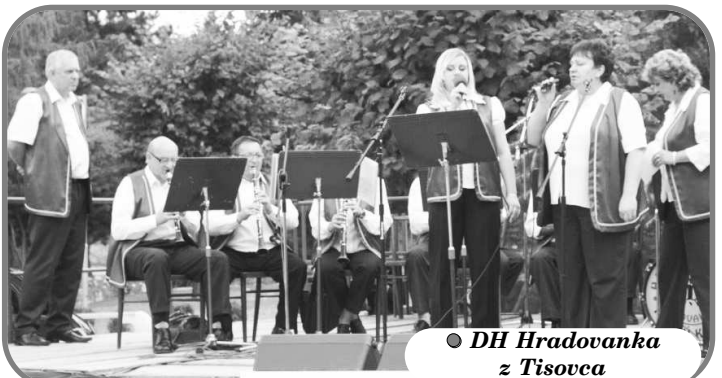
● DH Hradovanka z Tisovca