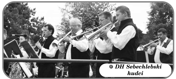
● DH Sebechlebskí hudci