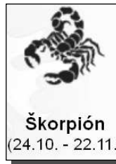
Škorpión (24.10. - 22.11.)

Nabehniete na systém predchádzajúceho týždňa. Zostanete verní svojmu spôsobu života a nebudete chcieť po tieto dni prijímať žiadne zmeny, ktoré však ani vo veľkom nebudú potrebné. Veľmi príjemnou súčasťou vášho života sú vaši najbližší priatelia, na ktorých nedáte nijako dopustiť a robíte správne. Avšak nikoho nedržte v tomto kruhu násilu a pokiaľ niekto chce odísť, pustite ho tak, ako sa to udeje práve po tieto dni. Tak, ako vás „opustí“, tak sa k vám, ak to tak má byť, aj vráti. Neprivilašujte si veci a už vôbec nie ľudí, akúkoľvek tendenciu tohto druhu hneď zazeňte.