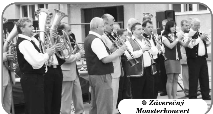
● Záverečný Monsterkoncert