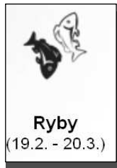
Ryby (19.2. - 20.3.)

Niekedy je lepšie mlčať, ako tváriť sa, že všetko viete a všetkému rozumiete najlepšie. Nikto vám vaše danosti a vedomosti neberie, ale niekedy ste svojou „chytrosťou“ a „všeznalosťou“, naozaj otravní, hlavne v prípade priateľských stretnutí, kde by mala vládnuť pohoda a oddychovanie – nie sklzánie priam do filozofických úvah, kde sa, ako inak, zviditeľníte a vyťahujete. Uvoľnite sa, počúvajte a pripustite si trošku viac aj prízemnejší humor – „sranda“ musí byť. V pracovnej sfére nastala doba skúšok, skúšania, preverovania. V oblasti lásky plňte svoje prísluby.