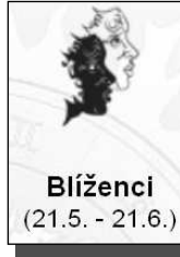
Blíženci (21.5. - 21.6.)

Uf, po prajnom týždni tu máme protikladnú zmenu. Zmeňte prístup sami k sebe. Prečo? Nuž, stáвате sa totiž sami sebe nepriateľmi (akoby v prenesenom význame lev hrýzol sám seba). Nepodkopávajúce si sebavedomie a priority, ktoré sa v tejto dobe na nejaký pomyselný rebrík umiestňujú veľmi ťažko. Pokiaľ sa vymenovaných výstrah vyvarujete, týždeň vám odhalí nekonečné možnosti vašich osobnostných úspechov, pri ktorých bude však určujúce načasovanie. Nastala hra štýlu hop alebo trop.