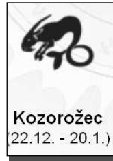
Kozorožec (22.12. - 20.1.)

Okolím budete vnímaní ako veľmi atraktívne bytosti. Budete okolo seba šíriť priam elektrické „erotično“ a tak sa pripravte na nejedno pozvanie na kávu, či večeru. Stanete sa obrovským lákadlom svojim šarmom, vystupovaním a konaním, čo by ste mohli využiť v prípade, že by ste šli na nejaký pohovor do novej práce alebo pre prípad, že spadáte medzi nezadaných kozorožcov. Vaše osobnostné čaro bude dosahovať takmer 100 percent. Okrem týchto nadelených kartových lichôtok však nastane situácia, kde bude musieť byť preukázaná vaša sila (ktorú máte), inak budete položení na lopatky (musíte sa ubrániť neprávou).