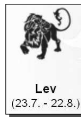
Lev (23.7. - 22.8.)

Ďalšie znamenie, kde sa otvára príklad, ako sa všetko z týždňa na týždeň môže zmeniť. Eufóriu vystrieda samolútosť a všetky negatívne pocity, ktoré so sebou prináša, vrátane podceňovania sa. Chce to len veriť si a potom pôjde všetko tak, ako má ísť. Tým môžete nadviazať na pozitívnosť a zdary, ktoré vám minulý týždeň otvoril. Viac v strehu buďte na pracovisku, kde sa na vás nejaké tie veci priam zosypú, nezanedbávajte svoje povinnosti, šéf by vám to dal poriadne pocítiť.