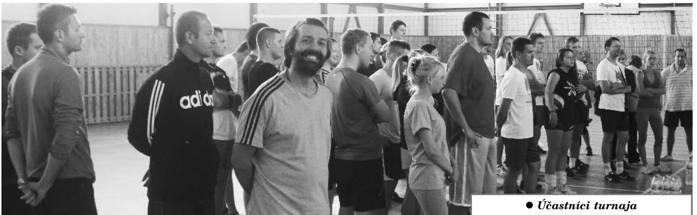
● Účastníci turnaja