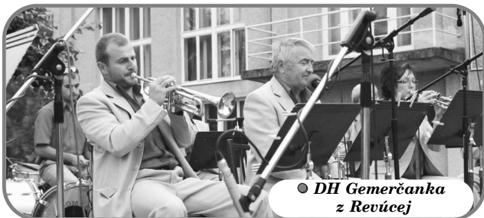
● DH Gemerčanka z Revúcej

Text: - ANDREJ BABIAR - HIOS Veľký Krtíš - Foto: Mgr. art. - IVAN VREDÍK -