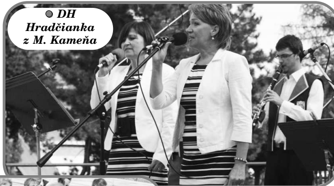
● DH Hradčianka z M. Kameňa

Počasiu tento rok podujatiu prišlo, keďže deň predtým vytrvalo pršalo, no v nedeľné popoludnie sa krásne vyčísilo a tak si početné publikum mohlo nerušene vypočuť štyri dychové hudby z nášho kraja a to: DH Sebechlebskí hudci zo Sebechlieb, domácu DH Hradčianka z Modrého Kameňa, DH Hradovanka z Tisovca a DH Gemerčanka z