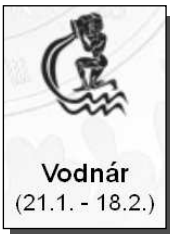
Vodnár (21.1. - 18.2.)

Tempo bude týmto dňom udávať váš osobný šarm, ktoré máte na rozdávanie. Nikto nedokáže odolať vašim presvedčiacim schopnostiam a podľa toho sa vám bude aj dariť. Všetko vám pôjde prekvapivo hladko a postupne.