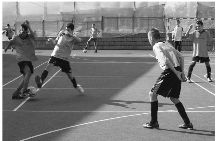
● Premiéru mal žiacky futbalový turnaj, ktorého sa zúčastnili tri pozvané družstvá