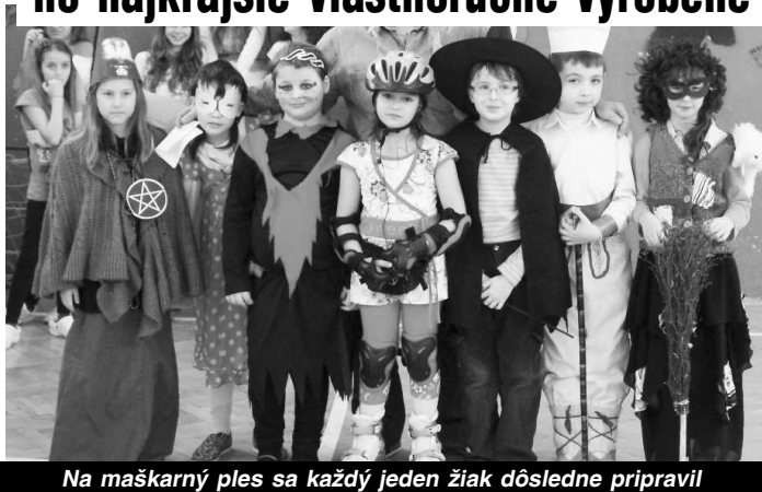
Na maškarný ples sa každý jeden žiak dôsledne pripravil

Všetky masky boli krásne, no najkrajšie vlastnoručne vyrobené