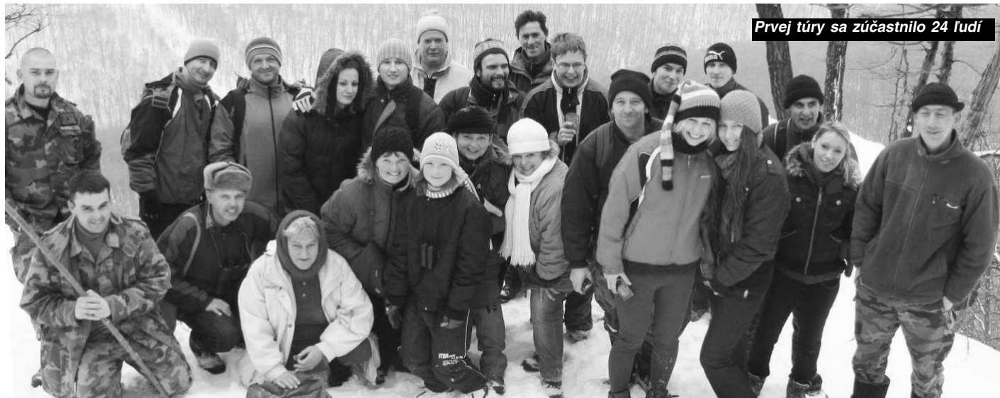
Prvej túry sa zúčastnilo 24 ľudí