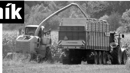
Z kukuričného poľa, kde sa stalo nešťastie, už na druhý deň (pondelok 3.9.) začali zberať kukuricu.