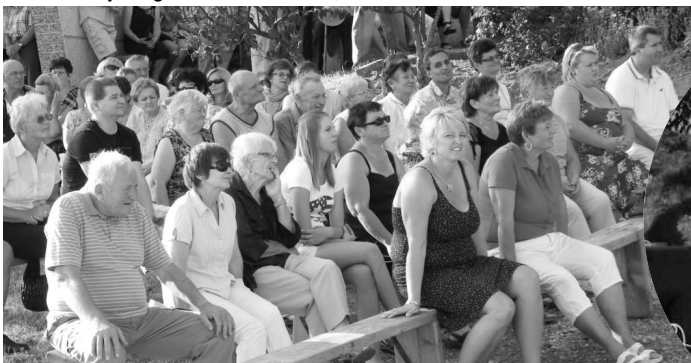
Veriaci Viničania sa stretli na slávnostnej svätej omši...