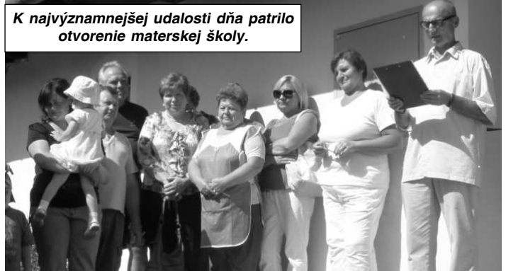
K najvýznamnejšej udalosti dňa patrilo otvorenie materskej školy.