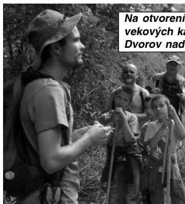
Na otvorení náučného chodníka sa zúčastnilo celkovo 77 ľudí vo všetkých vekových kategóriách. Prišli aj turisti - nadšenci z Popradu, Želiezoviec či z Dvorov nad Žitavou.