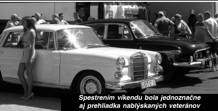
Spestrením víkendú bola jednoznačne aj prehliadka nablýskaných veteránov