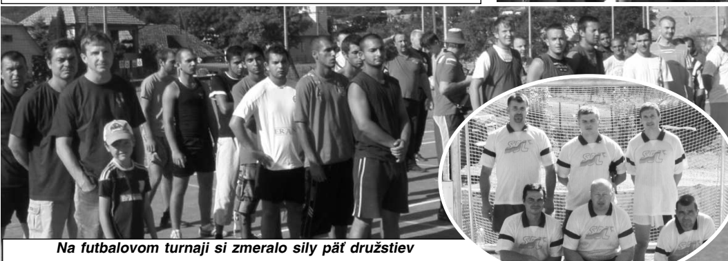
Na futbalovom turnaji si zmeralo sily päť družstiev