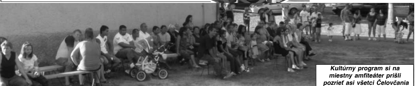
Kultúrny program si na miestny amfiteáter prišli pozrieť asi všetci Čelovčania